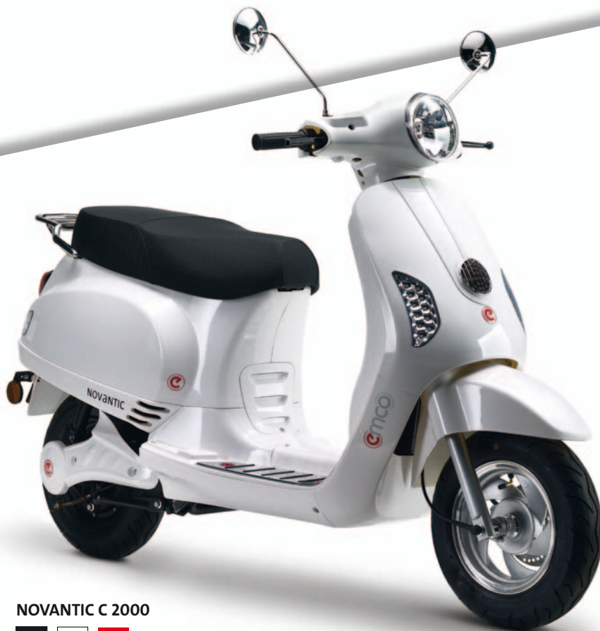
NOVANTIC C 2000